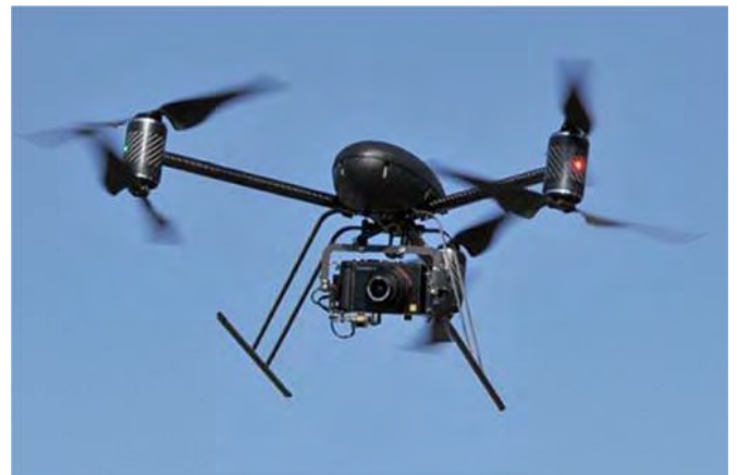
(그림 1) 드론(Drone)

서는 GPS 정보 등을 이용하여 드론에 대한 항공사고를 방지하기 위한 시스템을 제안한다. 이 시스템으로 드론의 항공 사고를 방지할 것이라고 기대한다.